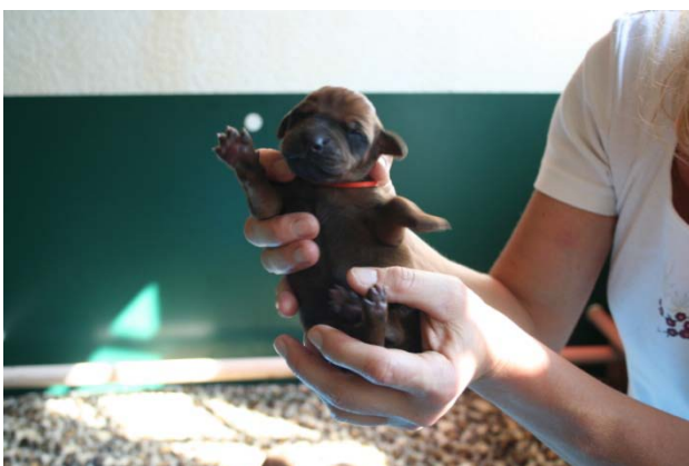
Rüde, orange, ohne weiß, Geburtsgewicht 450 g, 5. Baby 17:34