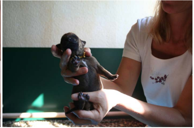
Rüde, goldgelb flach, kleiner weißer Strich, Geburtsgewicht 520 g, 2. Baby 16:23.