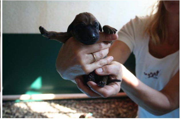
Rüde, braun, kein weiß, Geburtsgewicht 440 g, 8. Baby 19:53