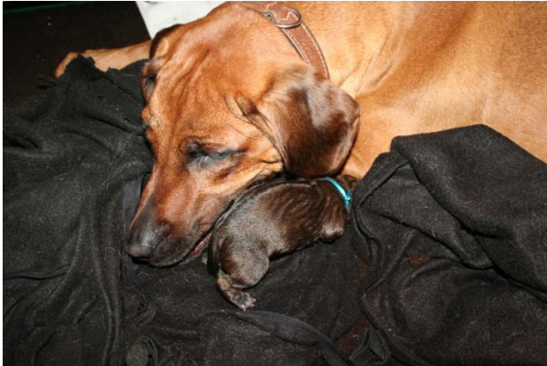
Mama mit Chobaki001, direkt Nach der Geburt

Gestern Morgen, 11 Uhr, haben nach 1 ½ Tagen alle Welpen ihr Geburtsgewicht wieder erreicht bzw. leicht zugenommen ☺. Jetzt möchte ich die Rasselbande kurz mit Bildern vorstellen: