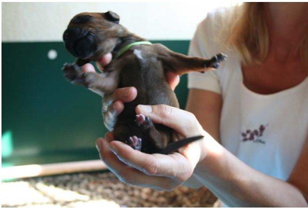
Hündin, grün, kleiner weißer Fleck, Geburtsgewicht 450 g, 3. Baby 16:38