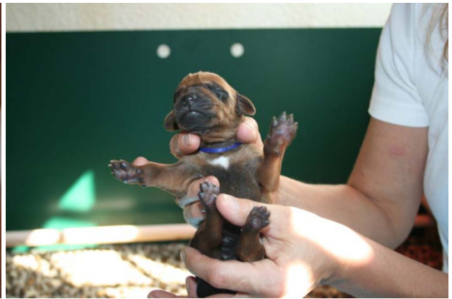
Hündin, dunkelblau, kleiner weißer Fleck, Geburtsgewicht 440 g, 4. Baby 16:50