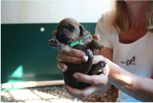
Rüde, grün rund, kleiner weißer Fleck, Geburtsgewicht 465 g, 7. Baby 19:34