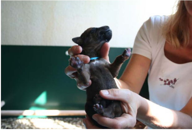
Hündin, hellblau, kleiner weißer Fleck, Geburtsgewicht 500 g, 1. Baby 15:08