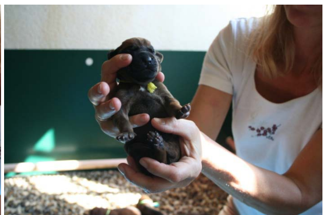
Rüde, gelb rund, kleiner weißer Fleck, Geburtsgewicht 470 g, 6. Baby 18:02